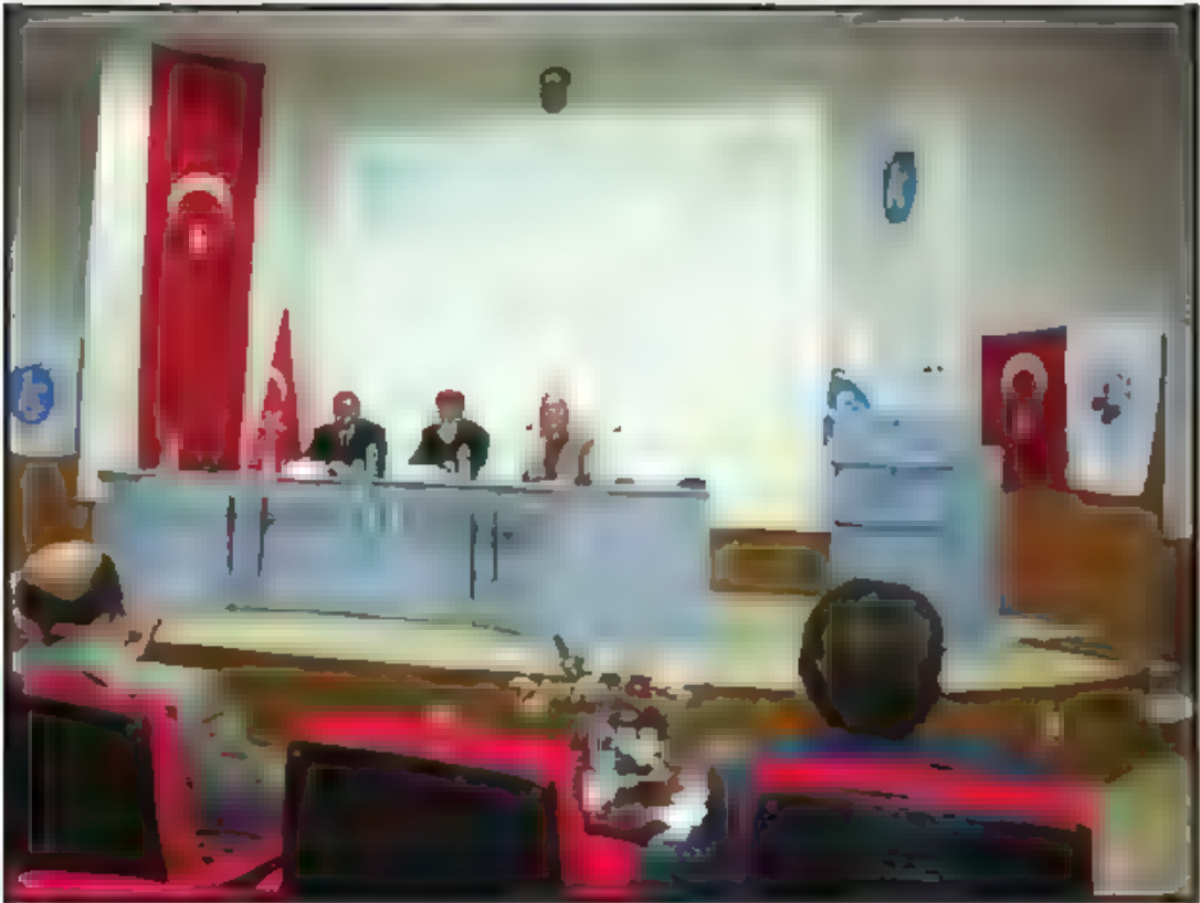
Beşinci Oturum – Türk Dış Politikasında Güvenlik ve Terör